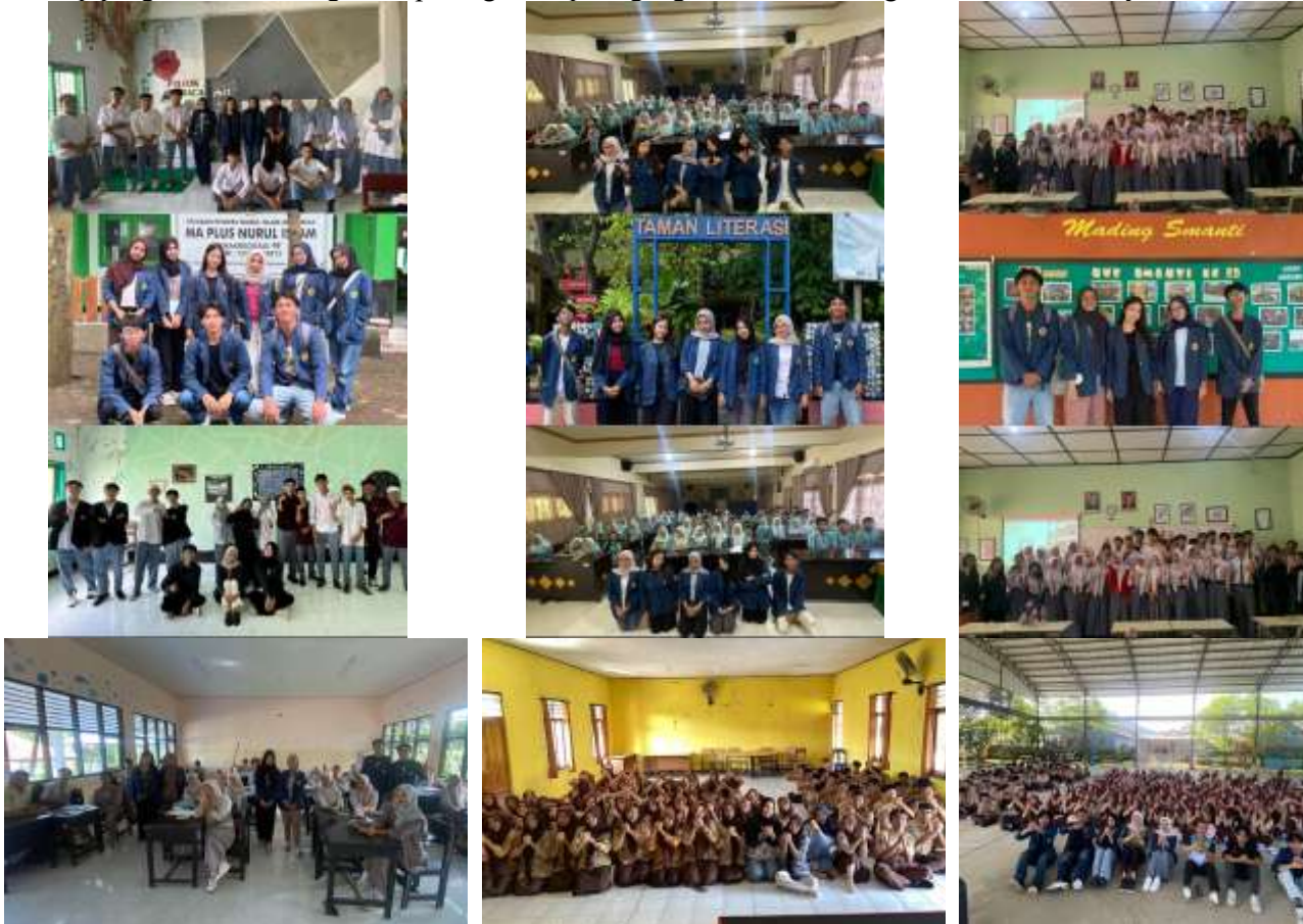
Gambar 2. Kegiatan Sosialisasi dan Promosi SNPMB 2026

Kegiatan sosialisasi dan promosi yang dilakukan oleh Program Studi Teknik Industri Universitas Mataram. Peningkatan skor minat sebesar 35,5% (gambar 4) menunjukkan bahwa pendekatan yang digunakan memiliki efektivitas yang tinggi dalam meningkatkan ketertarikan siswa. Secara khusus, indikator ketertarikan terhadap program studi mengalami peningkatan paling signifikan dibandingkan indikator lainnya.