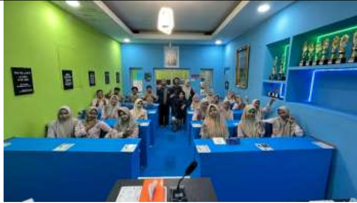
Gambar 1. Lokasi pengabdian sosialisasi dan promosi