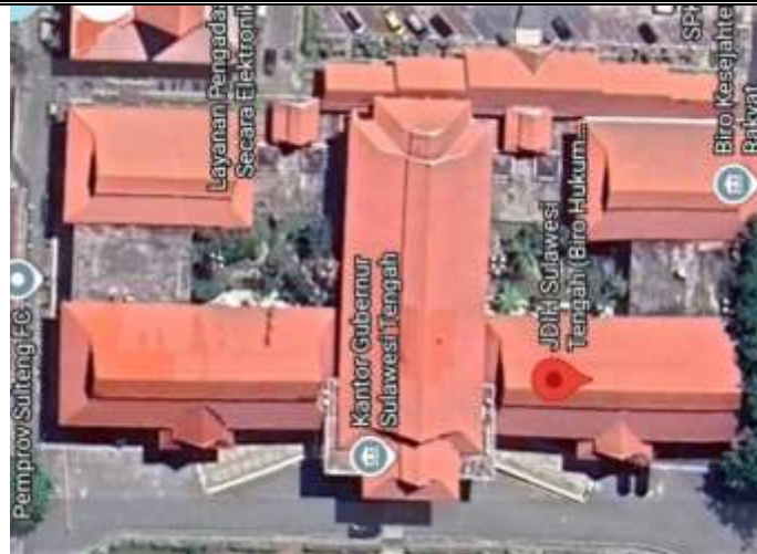
Gambar 1. Biro Hukum, Kantor Gubernur Sulawesi Tengah