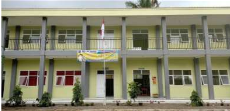
Gambar 1. Tempat Kegiatan Pengabdian Masyarakat

Kegiatan pengabdian ini dilaksanakan di MA Al-Misri, Curahmalang, Kecamatan Rambipuji, Kabupaten Jember. Sekolah mitra berada di lingkungan pedesaan dengan fasilitas pembelajaran yang cukup memadai. Foto lokasi menunjukkan ruang kelas yang digunakan dalam kegiatan pelatihan, yang dilengkapi dengan sarana pembelajaran standar seperti papan tulis, meja siswa, dan ruang diskusi kelompok. Kondisi ini mendukung penerapan pembelajaran berbasis media kartu yang membutuhkan interaksi aktif antar siswa.