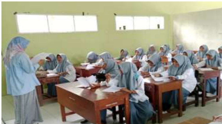
Gambar 2. Kegiatan Observasi terhadap Siswa

Kegiatan pelatihan penulisan kalimat majemuk setara dan bertingkat diawali dengan observasi untuk mengetahui kemampuan awal siswa kelas XI MA Al-Misri dalam memahami dan menyusun kalimat majemuk. Observasi dilakukan menggunakan kuesioner yang terdiri atas soal pilihan ganda dan soal penyusunan kalimat majemuk setara maupun bertingkat. Hasil observasi awal menunjukkan bahwa kemampuan siswa masih rendah, terutama pada aspek penggunaan konjungsi dan pemahaman struktur kalimat. Pada tahap awal ditemukan total 278 kesalahan dengan persentase kesalahan sebesar 55,6%. Kesalahan paling dominan terdapat pada pemahaman struktur kalimat majemuk bertingkat, khususnya dalam menentukan induk dan anak kalimat.