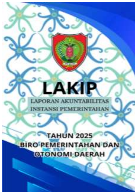
Gambar 4. Halaman Sampul Dokumen LAKIP Tahun 2025

Selain itu, kegiatan ini memberikan dampak pada peningkatan pemahaman aparatur terhadap penyusunan laporan berbasis kinerja. Aparatur menjadi lebih memahami pentingnya indikator yang terukur, keterkaitan antara target dan realisasi, serta penyajian data yang akurat sebagai bentuk pertanggungjawaban publik.