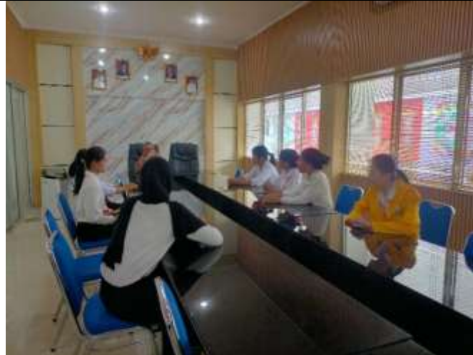
Gambar 3. Proses pendampingan penyusunan LAKIP

Hasil kegiatan menunjukkan adanya perbaikan dalam sistematika penyusunan laporan, terutama pada keterpaduan antara dokumen perencanaan dan pelaporan kinerja. Penyajian data menjadi lebih terstruktur sehingga memudahkan dalam proses evaluasi kinerja serta pengambilan keputusan.