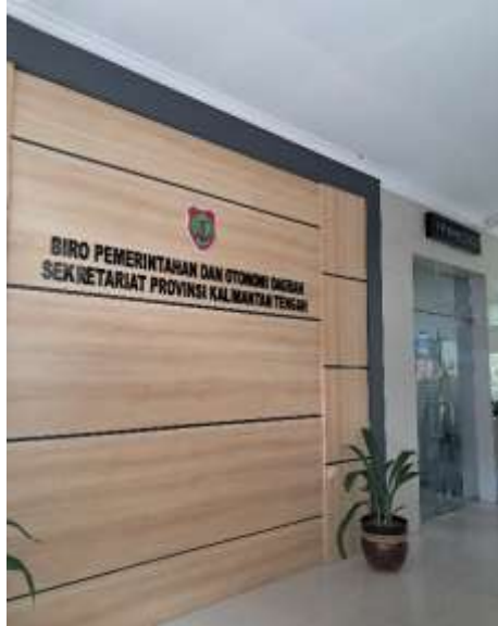
Gambar 1. Kondisi lingkungan kerja Biro Pemerintahan dan Otonomi Daerah

Dalam pelaksanaannya, masih terdapat beberapa permasalahan yang memengaruhi kualitas akuntabilitas kinerja instansi. Penyusunan Laporan Akuntabilitas Kinerja Instansi Pemerintah belum sepenuhnya optimal. Dokumen yang dihasilkan masih cenderung bersifat administratif dan belum menggambarkan keterkaitan yang kuat antara perencanaan, pelaksanaan, dan capaian kinerja. Indikator kinerja yang digunakan juga belum sepenuhnya spesifik dan terukur sehingga menyulitkan dalam proses evaluasi.