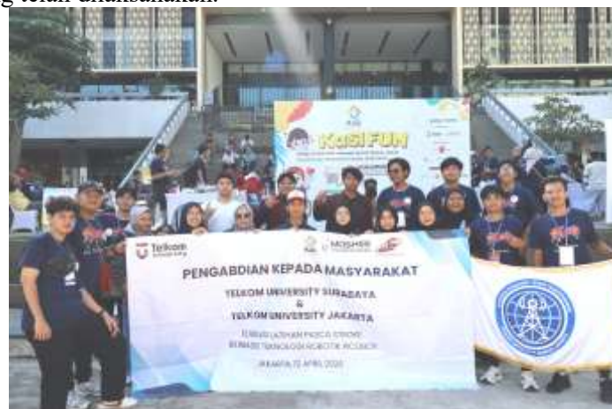
Gambar 6. Tahapan Pasca Kegiatan

Sebagai fase penutup dalam kegiatan pengmas, tahapan pasca kegiatan memegang peranan yang juga krusial. Pada fase ini, evaluasi menyeluruh terhadap dampak program dianalisis secara mendalam, yang diikuti dengan pendokumentasian, serta penyusunan rekomendasi tindak lanjut guna memelihara retensi manfaat program bagi komunitas sasaran. Selain berfungsi sebagai instrumen penjaminan mutu, evaluasi pasca kegiatan dimanfaatkan sebagai dasar rekomendasi adaptif bagi perbaikan program pengmas di masa depan. Pengukuran sejauh mana pelaksanaan program mampu mengakomodasi tujuan dan kebutuhan mitra dilakukan melalui penyebaran kuesioner evaluasi pada fase akhir kegiatan. Data yang dihimpun melalui instrumen tersebut kemudian dianalisis untuk memperoleh konfirmasi objektif mengenai efektivitas tatalaksana kegiatan yang telah dilaksanakan.