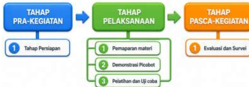
Gambar 3. Tahapan Kegiatan Pengmas Edukasi Latihan Berbasis Teknologi Robotik Picobot

Kegiatan pengmas berkolaborasi dengan KASI dimana dirancang menggunakan pendekatan partisipatif berbasis komunitas dan pelatihan berbasis praktik langsung. Seperti tampak pada Gambar 3, rangkaian kegiatan dibagi secara sistematis menjadi tiga tahapan inti: pra kegiatan sebagai langkah tatalaksana awal, pelaksanaan sebagai inti intervensi, dan pasca kegiatan sebagai terminasi evaluative.