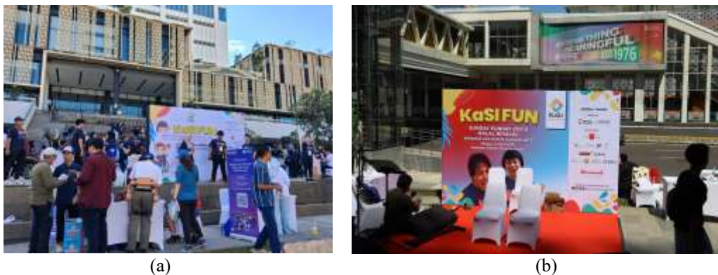
Gambar 1. (a) Tampak Depan dan (b) Tampak Belakang Area Kegiatan di Pelantaran Sarinah Jakarta

Selama ini, kegiatan rehabilitasi yang dilakukan masih didominasi oleh pendekatan konvensional dan latihan fisik sederhana, sehingga belum mampu mengoptimalkan pemanfaatan teknologi kesehatan modern dalam mendukung terapi yang lebih efektif, interaktif, dan berkelanjutan. Kondisi tersebut menjadi tantangan tersendiri mengingat sebagian besar penyintas stroke memerlukan rehabilitasi jangka panjang untuk meningkatkan fungsi motorik, kemandirian, dan kualitas hidup. Berdasarkan permasalahan tersebut, tim pengabdian kepada masyarakat berkolaborasi dengan KASI melalui implementasi robot Picobot, yaitu perangkat rehabilitasi berbasis robotik yang dikembangkan oleh Universitas Telkom (Kampus Surabaya) sebagai media terapi dan edukasi teknologi kesehatan bagi pasien pasca stroke. Kolaborasi ini diharapkan dapat meningkatkan literasi teknologi kesehatan sekaligus mendukung proses rehabilitasi penyintas stroke secara lebih inovatif, adaptif, dan berkelanjutan. Pelantaran Sarinah dipilih sebagai lokasi kegiatan karena merupakan ruang publik yang inklusif, bebas kendaraan bermotor, dan secara rutin diakses oleh berbagai lapisan masyarakat, termasuk komunitas penyandang disabilitas dan penyintas penyakit kronis. Ketersediaan infrastruktur yang memadai dan suasana yang kondusif menjadikan CFD sebagai platform ideal untuk kegiatan edukasi kesehatan berbasis komunitas.