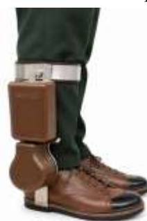
Gambar 2. Picobot

Pelaksanaan pengabdian kepada masyarakat ini diorientasikan untuk memberdayakan individu pasca stroke melalui penguatan aspek literasi, keterampilan, dan kemandirian dalam kerangka rehabilitasi fisik. Target tersebut dicapai dengan mendayagunakan teknologi robotik kolaboratif Picobot sebagai solusi rehabilitasi yang inovatif. Pengembangan Picobot dilakukan oleh tim peneliti MOSHEE Universitas Telkom (Kampus Surabaya) dengan dukungan finansial dari skema hibah internal institusi serta hibah eksternal Kementerian Pendidikan, Kebudayaan, Riset, dan Teknologi Republik Indonesia. Gambar 2 merupakan alat Picobot yang akan digunakan dalam kegiatan pengmas dan instrumen ini berfungsi sebagai penunjang dalam asistensi fisioterapi pergelangan kaki melalui manipulasi gerakan otomatis berupa dorsifleksi dan plantarfleksi, yang diimplementasikan pada metode latihan statis maupun berjalan dinamis. Mekanisme penempatan perangkat pada kaki pasien memanfaatkan material Velcro, sementara kontrol operasionalnya diintegrasikan secara digital oleh tenaga terapis melalui mobile apps .