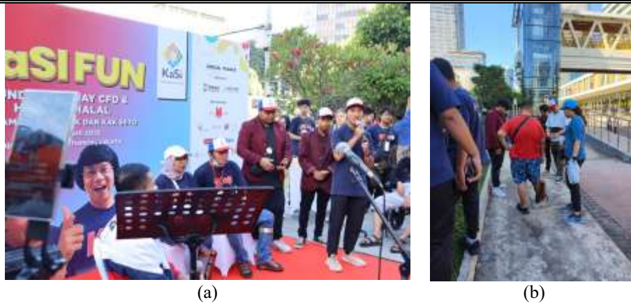
Gambar 5. Tahapan Kegiatan Pengmas (a)Pemaparan Materi, Demonstrasi, serta (c) Uji Coba Picobot

Sebagai fase penutup dalam kegiatan pengmas, tahapan pasca kegiatan memegang peranan yang juga krusial. Pada fase ini, evaluasi menyeluruh terhadap dampak program dianalisis secara mendalam, yang diikuti dengan pendokumentasian, serta penyusunan rekomendasi tindak lanjut guna memelihara retensi manfaat program bagi komunitas sasaran. Selain berfungsi sebagai instrumen penjaminan mutu, evaluasi pasca kegiatan dimanfaatkan sebagai dasar rekomendasi adaptif bagi perbaikan program pengmas di masa depan. Pengukuran sejauh mana pelaksanaan program mampu mengakomodasi tujuan dan kebutuhan mitra dilakukan melalui penyebaran kuesioner evaluasi pada fase akhir kegiatan. Data yang dihimpun melalui instrumen tersebut kemudian dianalisis untuk memperoleh konfirmasi objektif mengenai efektivitas tatalaksana kegiatan yang telah dilaksanakan.