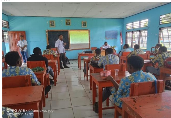
Gambar 1. Proses Kegiatan yang sedang berlangsung