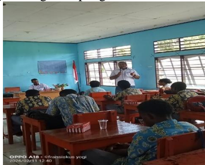
Gambar 2. Proses Sosialisasi yang sedang berlangsung

Materi tahap pendampingan dalam kegiatan pengabdian kepada masyarakat merupakan rangkaian pembinaan yang diberikan kepada masyarakat sasaran agar mampu memahami, menerapkan, dan mengembangkan hasil program secara mandiri dan berkelanjutan. Pendampingan dilakukan secara terarah sesuai kebutuhan masyarakat dan tujuan kegiatan pengabdian.