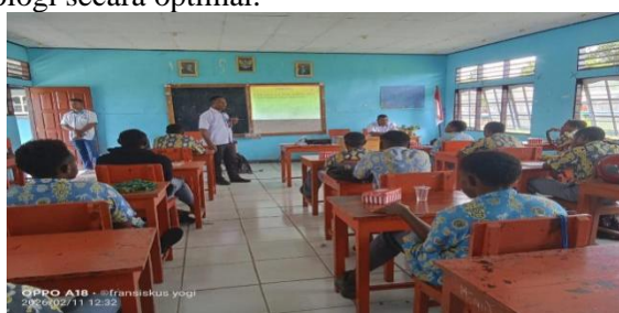
Gambar 4. Foto bersama Tim PKM beserta para Peserta

Lebih jauh, peningkatan kemampuan para siswa ini menciptakan efek berantai dalam lingkungan sekolah. lebih percaya diri untuk dapat memilih Fakultas Perikanan Dan Kelautan (Uswim) sehingga terbentuk Proses pembelajaran yang sebelumnya bersifat konvensional kini mulai mengalami perubahan signifikan, di mana peserta didik lebih aktif dalam eksplorasi materi, melakukan refleksi, dan berinteraksi secara dinamis melalui media digital. Selain itu memudahkan personalisasi pembelajaran, memungkinkan minat masing-masing siswa. Hal ini berdampak positif pada peningkatan keterlibatan siswa, penguasaan materi yang lebih mendalam, serta kemampuan berpikir kritis dan kreatif yang lebih tinggi. Dengan demikian, kegiatan sosialisasi ini tidak hanya meningkatkan keterampilan siswa secara individu, tetapi juga mendorong transformasi sistem pembelajaran dalam memahami dunia Perikanan Dan Kelautan yang lebih adaptif, inklusif, pada pemanfaatan teknologi secara optimal.