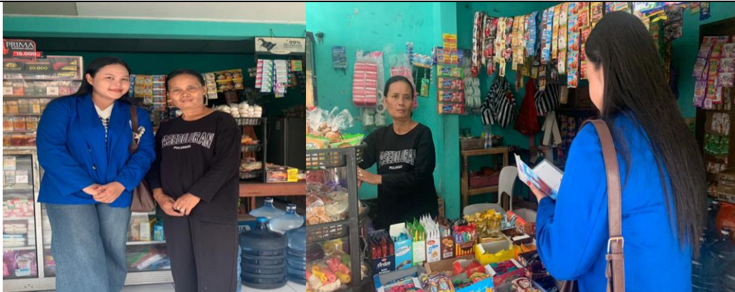
Gambar 3 Dekumentasi Pencatatan Keuangan Sederhana

Langkah berikutnya adalah memberikan sosialisasi singkat tentang pentingnya memanfaatkan digitalisasi misalnya melalui Google Maps sebagai sarana pemasaran, sekaligus menyampaikan penjelasan mengenai betapa krusialnya pencatatan keuangan sederhana bagi UMKM Dalam tahap digitalisasi ini, para pemilik usaha mendapatkan pendampingan terkait penggunaan teknologi digital, seperti pemanfaatan Google Maps untuk memperluas cakupan wilayah pemasaran usaha Sebelum kegiatan ini dilaksanakan, toko kelontong yang menjadi sasaran belum memiliki identitas digital, sehingga keberadaan usaha tersebut sulit dijangkau oleh konsumen baru Setelah pendampingan selesai, toko kelontong berhasil didaftarkan ke dalam Google Maps, sehingga lokasi usahanya kini mudah ditemukan oleh masyarakat luas Di samping itu, pelaku usaha juga mulai memahami manfaat penggunaan teknologi digital sebagai alat promosi sekaligus peningkatan layanan kepada pelanggan Digitalisasi ini memberikan keuntungan yang cukup signifikan karena turut mendongkrak visibilitas usaha di lingkungan sekitarnya Konsumen dapat mengetahui alamat toko dengan lebih praktis, yang pada gilirannya berpotensi meningkatkan jumlah pelanggan serta volume penjualan usaha (Aprilia & Wafa, 2023; Maharani et al, 2024; Yusuf et al, 2021)