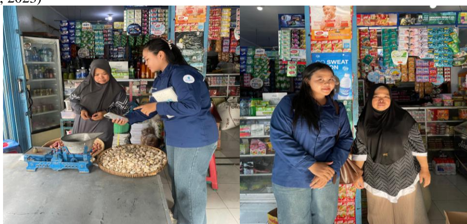
Gambar 4 Dekumentasi Pembuatan Google Maps

Tahap akhir dari kegiatan ini adalah evaluasi Berdasarkan pelaksanaan pelatihan dan pendampingan yang berlangsung dari tanggal 20 April 2026 hingga 30 April 2026, diperoleh hasil capaian dari program pengabdian ini, yakni para pemilik usaha sudah mampu memanfaatkan Google Maps sebagai alat promosi bisnis mereka serta dapat mengelolanya secara berkala untuk memasarkan produk dagangan Selain itu, para pelaku usaha juga sudah mampu menerapkan pencatatan keuangan sederhana secara rutin dan baik selama masa pendampingan, dan diharapkan kebiasaan ini dapat terus berlanjut ke depannya (Nenta & Astuti, 2023; Santi & As'ari, 2023)