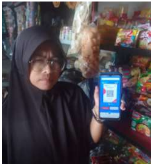
Gambar 6. Hasil Penerapan Digitalisasi Keuangan Menggunakan QRIS

Kegiatan ini juga menunjukkan bahwa digitalisasi keuangan dapat meningkatkan efisiensi pencatatan transaksi UMKM. Aplikasi pencatatan digital juga meningkatkan manajemen keuangan pemilik usaha (Mompala & Utami, 2023).