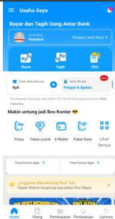
Gambar 7. Tampilan Aplikasi BukuWarung

Akan tetapi, selama proses penerapan digitalisasi keuangan dan penyusunan laporan keuangan masih ditemukan beberapa hambatan, seperti rendahnya pemahaman terkait teknologi digital, kebiasaan lama dalam pencatatan keuangan usaha, dan kurang disiplin dalam mencatat transaksi harian, membuat pelaku usaha masih memerlukan penyesuaian dan pendampingan lebih lanjut dalam penggunaan sistem digital dan pencatatan transaksi dalam kegiatan operasional usaha sehari-hari. Sebagai saran, pengabdian menganjurkan pemilik untuk lebih konsisten dalam melakukan pencatatan transaksi harian, juga pemilik dapat mengikuti beberapa program pelatihan sederhana yang dibuat untuk UMKM agar penerapan tersebut dapat mendukung dalam meningkatkan efektivitas usaha.