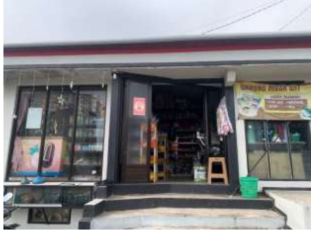
Gambar 1. UMKM Warung Kelontong Mbak Wit