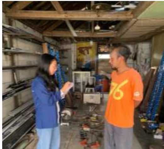
Gambar 5. Pendampingan Penyusunan Laporan Keuangan Sederhana