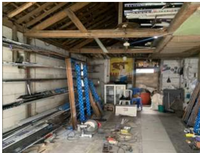
Gambar 2. UMKM Kurnia Aluminium dan Kaca