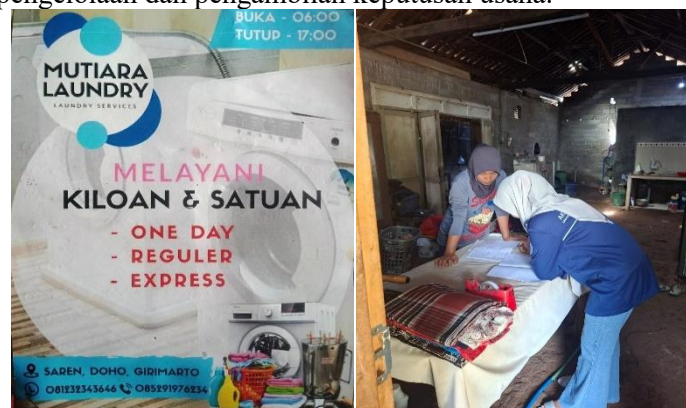
Gambar 3. Praktik pencatatan pada usaha laundry

Oleh karena itu, diperlukan pendampingan melalui penerapan akuntansi sederhana agar pencatatan transaksi menjadi lebih tertib dan mudah diterapkan. Dengan adanya pembukuan sederhana, pelaku usaha diharapkan mampu mencatat setiap pemasukan dan pengeluaran secara konsisten serta menyusun laporan keuangan sebagai dasar pengelolaan dan pengambilan keputusan usaha.