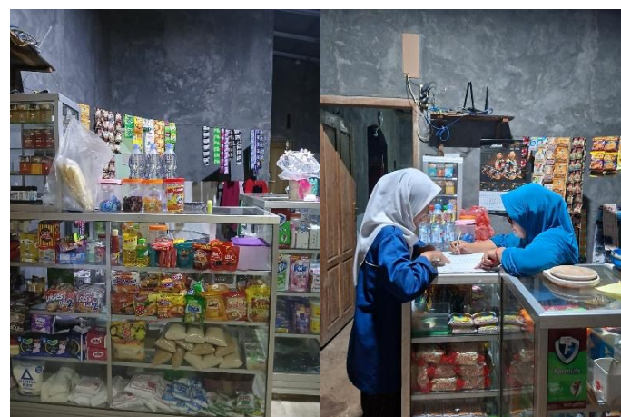
Gambar 4. Kondisi usaha dan praktik pencatatan pada warung kelontong