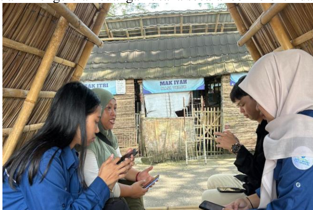
Gambar 1. Wawancara dengan pemilik UMKM

Setelah kegiatan observasi dikerjakan, tahap selanjutnya yaitu mengerjakan wawancara secara langsung dengan pelaku UMKM untuk mendapat informasi yang lebih mendalam terkait kondisi usaha dan permasalahan yang dihadapi. Wawancara dikerjakan dengan membahas proses pengelolaan usaha, khususnya pada bagian pencatatan dan pengelolaan keuangan. Dari hasil wawancara tersebut diketahui bahwa pelaku UMKM masih mengerjakan pencatatan keuangan secara manual dan sederhana, bahkan beberapa transaksi usaha belum dicatat secara rutin. Pelaku usaha mengaku masih mengalami kesulitan dalam membedakan antara keuangan pribadi dan keuangan usaha sehingga kondisi keuangan usaha sulit diketahui secara jelas. Karena itu, diperlukan penerapan pencatatan keuangan berbasis digital untuk membantu pelaku UMKM dalam mengelola keuangan usaha secara lebih efektif dan teratur.