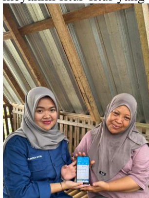
Gambar 2. Pelatihan pendampingan penggunaan aplikasi

Sebelum penerapan sistem pencatatan digital itu dikerjakan, saya terlebih dahulu mengadakan pelatihan ke pelaku UMKM terkait cara penggunaan aplikasi. Aplikasi yang saya gunakan ialah aplikasi BukuWarung. Aplikasi tersebut ialah untuk memudahkan pencatatan agar lebih mudah dan praktis. Pelatihan ini guna menyajikan pemahaman terkait krusialnya pencatatan keuangan digital serta membantu pelaku usaha meyakini cara mencatat pemasukan, pengeluaran, dan transaksi usaha secara lebih mudah dan teratur. Melalui pelatihan tersebut, pelaku UMKM dapat mempraktikkan langsung penggunaan aplikasi sehingga lebih mudah meyakini fitur-fitur yang tersedia dan mampu menerapkannya dalam kegiatan usaha sehari-hari.