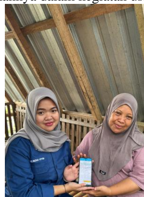
Gambar 3. Mencoba untuk menggunakan aplikasi

Selain menyajikan kemudahan dalam pencatatan keuangan, kegiatan ini juga menaikkan pengetahuan dan kesadaran pelaku UMKM terkait krusialnya pengelolaan keuangan yang baik untuk menyokong perkembangan usaha. Penerapan sistem pembukuan digital agar mudah diterapkan untuk mencatat pemasukan dan pengeluaran, sistem digital juga dapat dikembangkan untuk membantu penyusunan laporan keuangan, pengelolaan stok barang, hingga pemantauan perkembangan usaha secara lebih terstruktur. Seiring berkembangnya teknologi dan meningkatnya kebutuhan pelaku usaha terhadap sistem pencatatan