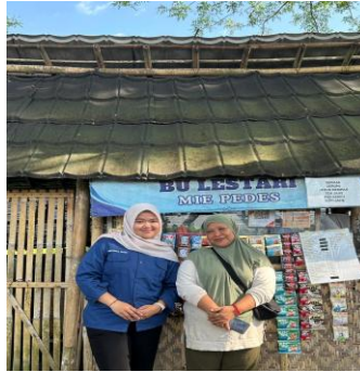
Gambar 4. Evaluasi Kegiatan

Evaluasi kegiatan pengabdian ke rakyat ini menampakkan pelaksanaan pelatihan dan pendampingan penggunaan aplikasi BukuWarung menyajikan dampak positif bagi pelaku UMKM dalam pengelolaan keuangan usaha. Setelah mengikuti kegiatan, pelaku usaha mulai meyakini krusialnya pencatatan keuangan yang teratur serta mampu mengerjakan pencatatan pemasukan dan pengeluaran usaha menerapkan aplikasi digital. Penggunaan aplikasi dinilai lebih praktis dan membantu proses pembukuan menjadi lebih rapi serta mudah dipahami.