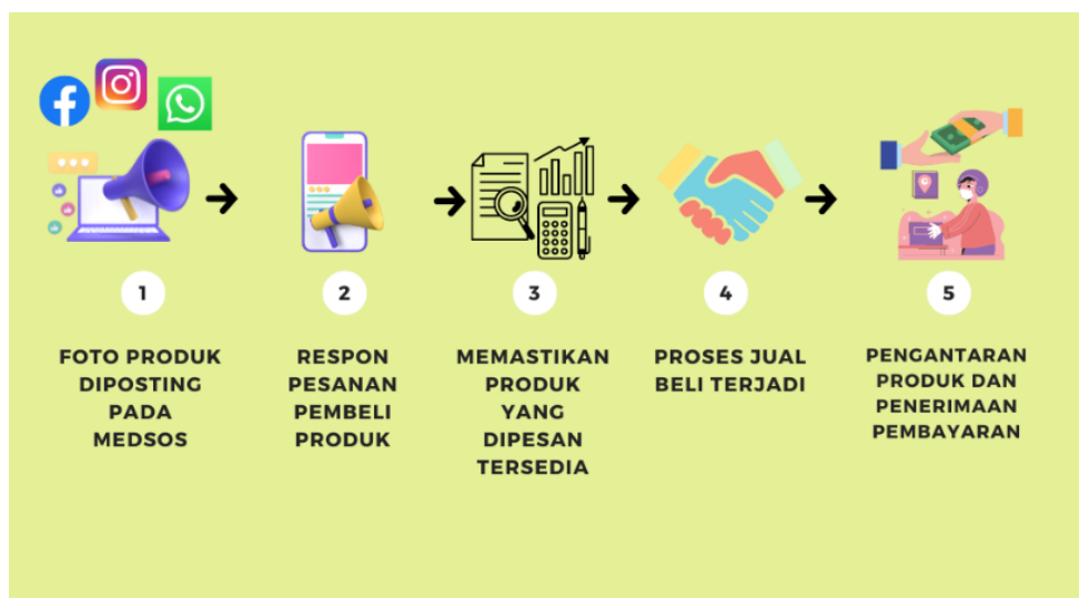
Gambar 5. Model Pemasaran Online dan Penjualan Produk