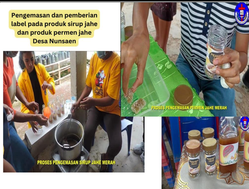
Gambar 3. Merupakan Proses Pengemasan dan Pemberian Label Produk Permen Jahe dan Sirup Jahe