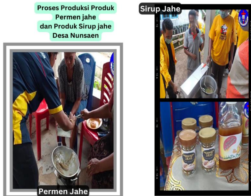
Gambar 2. Merupakan Proses Produksi Permen Jahe dan Sirup Jahe