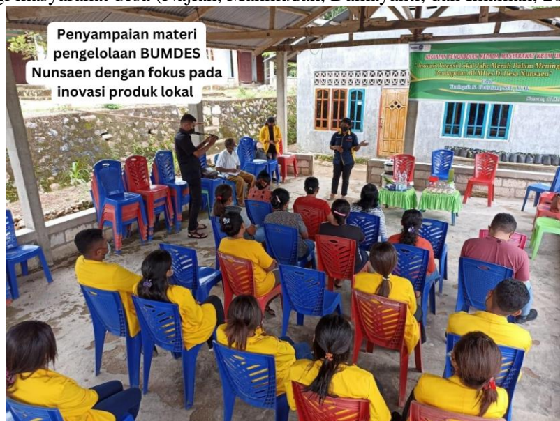
Gambar 4. Merupakan Penyampaian Materi Pengelolaan BUMDES

Manajemen usaha yang dilakukan meliputi perencanaan produksi produk hingga pelaksanaan produksi, pemasaran produk, pembukuan transaksi sederhana dan pelaporan keuangan. Tim PKM memberikan penjelasan pula kepada masyarakat dan anggota BUMDES mengenai bagaimana pengelolaan dana BUMDES yang baik serta bagaimana BUMDES Nunsauen berperan dalam memaksimalkan pengelolaan potensi lokal yang tersedia di Desa Nunsauen. Peran BUMDES dinilai penting karena menjadi lokomotif kesejahteraan bagi masyarakat desa (Najiah, Mahmudah, Damayanti, dan Imamah, 2022).