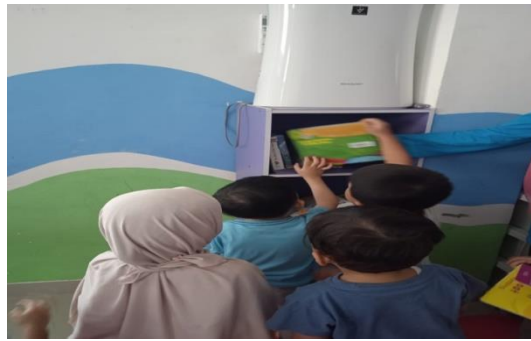
Gambar. 8 Memilih Buku