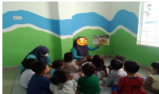
Gambar. 9 Mendengarkan cerita