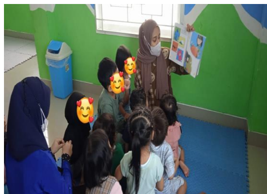
Gambar. 10 Anak ditanya mengenai makna buku