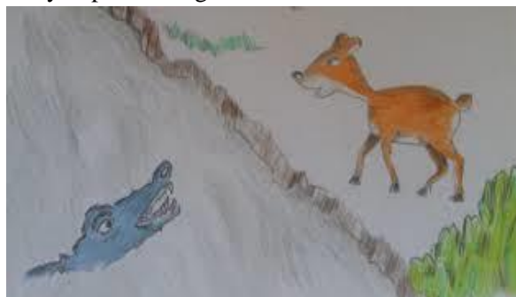
Gambar. 7 Ilustrasi Warna Karakter Kancil

Langkah terakhir adalah memberi arsiran atau warna pada objek cerita sesuai dengan karakter cerita misalnya dengan memberikan efek gelap terang untuk mempertegas cerita atau menambahkan detail – detail tertentu untuk menyempurnakan gambar ilustrasi.