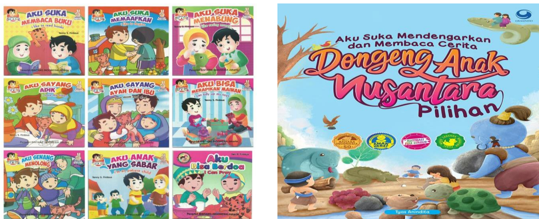
Gambar 12 buku cerita

Pada gambar dibawah ini merupakan contoh – contoh buku yang akan digunakan peneliti dalam proses kegiatan pengabdian.