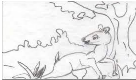
Gambar. 4 Ilustrasi Kancil