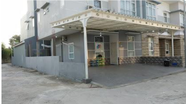
Gambar.1 Lokasi Pengabdian

Berdasarkan pengabdian yang peneliti lakukan bahwasanya permasalahan yang ada di lokasi pengabdian masyarakat yaitu kurangnya minat baca anak juga butuhnya stimulasi terhadap perkembangan kognitif anak usia dini.