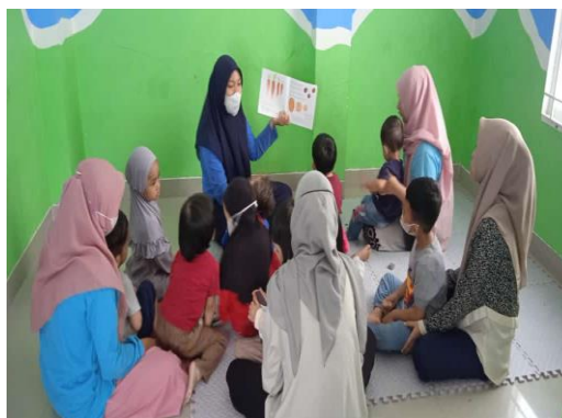
Gambar. 11 Anak diajak diskusi

Melakukan tanya jawab dan diskusi tentang cerita yang sudah disampaikan