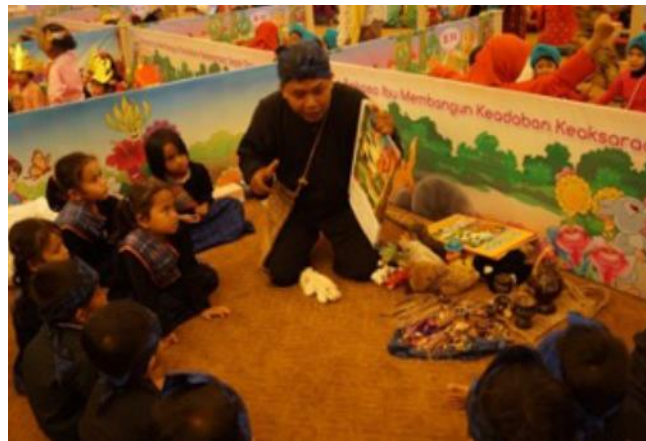
Gambar. 2 Gambar storytelling

Perkembangan teknologi yang terjadi saat ini sangat berpengaruh terhadap kehidupan khususnya dalam dunia pendidikan. Perkembangan era globalisasi yang sangat pesat menuntut dunia pendidikan untuk menyesuaikan perkembangan teknologi informasi terhadap usaha dalam meningkatkan kualitas pendidikan. Salah satunya adalah ilustrasi yang dapat membantu mendorong kebiasaan membaca anak. Dengan adanya ilustrasi anak akan terdorong untuk membaca teks yang akan kemudian meningkatkan minat mereka untuk membaca peran penting ilustrasi dalam membaca cerita bergambar anak juga dapat meningkatkan kenikmatan teks dengan kata lain, anak – anak lebih menikmati teks jika mereka melihat gambar dan menghubungkannya dengan kalimat dalam teks. Ilustrasi juga dapat merangsang imajinasi anak – anak dan kemampuan mereka untuk menyimpulkan informasi dan menarik kesimpulan sendiri.