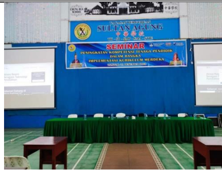
Gambar 1. Lokasi PKM