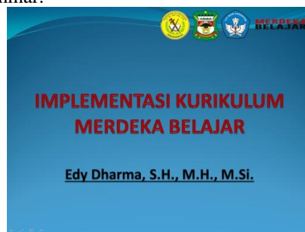
Gambar 2. Materi Presentasi

Tahap persiapan meliputi (1) penentuan tujuan seminar yaitu memperkenalkan kurikulum Merdeka Belajar, membahas implementasi kurikulum Merdeka Belajar di sekolah, atau memberikan strategi dalam mengimplementasikan kurikulum Merdeka Belajar. Seminar ini dilakukan karena masih rendahnya pemahaman terkait konsep dan tujuan kurikulum Merdeka Belajar. Hal inilah yang menjadi kendala dalam mengimplementasikan kurikulum Merdeka Belajar (Suhadi, S. & Winarno, 2018); (Yusuf, 2019); (2) menentukan narasumber yaitu tim pengabdian yang merupakan akademisi yang memiliki kompetensi dan pengalaman yang relevan dengan topik seminar; (3) menyiapkan materi seminar yang relevan dengan topik yang akan disampaikan. Materi disusun dengan sistematis, mudah dipahami, dan mampu membangkitkan minat peserta seminar; (4) menentukan waktu dan tempat yang sesuai dengan kebutuhan narasumber dan peserta serta dilengkapi dengan fasilitas yang memadai; (5) menyebarkan informasi berupa undangan kepada Kepala Dinas Pendidikan Kota Pematang Siantar, Kepala Sekolah dan guru SMP Swasta Sultan Agung Pematang Siantar; (5) menyiapkan fasilitas berupa alat presentasi, sound system , meja dan kursi untuk peserta dan narasumber, dan perlengkapan seminar lainnya; (6) mempersiapkan evaluasi berupa kuesioner untuk mengetahui keberhasilan seminar.