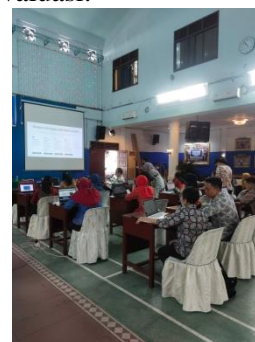
Gambar 3. Pelaksanaan Seminar