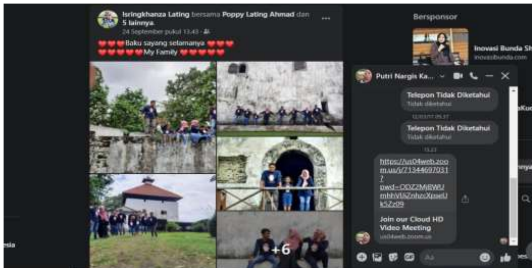
Gambar 2. Postingan Wisatawan

Sosial media menjadi salah satu media promosi yang paling tepat karena informasi yang disampaikan baik berupa teks, foto maupun video cepat tersebar luas di publik. Sekarang internet banyak dijadikan alat untuk mencari penghasilan baik usaha online maupun offline, biaya internet yang semakin murah dan perangkat yang semakin mudah dan murah didapatkan seperti Handpone, tablet, komputer semakin memudahkan orang untuk mengakses informasi yang diinginkan, juga dengan pengguna sosial media yang semakin tak terhitung jumlahnya hampir seluruh penduduk di muka bumi menggunakannya dan ini merupakan prospek yang bagus untuk dijadikan market potensial untuk wisata yang dipromosikan. Seperti promosi benteng Amsterdam yang dilakukan oleh para wisatawan domestik maupun manca negara yang ambil melalui laman Facebook, Instagram dan Twitter.