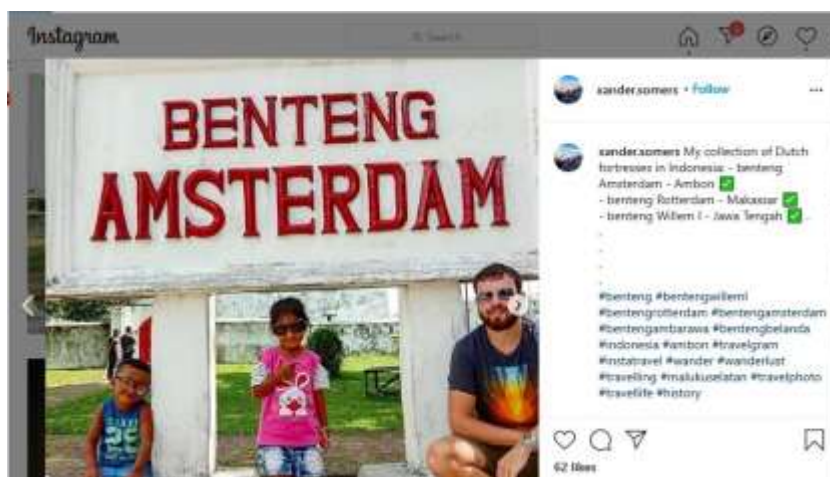
Gambar 3. Postingan Wisatawan di Instagram

Alhasil kemajuan teknologi saat ini membawa suatu perubahan yang cepat dalam suatu kehidupan manusia dengan tanpa batas dan lebih efektif, salah satu dampak teknologi adalah hadirnya masyarakat informasi, bahkan bukan saja wisatawan domestik wisatawan mancanegapun banyak yang berkunjung ke benteng Amsterdam yang ada di Negeri Hila ini. Moh. Udin lating melanjutkan dalam wawancaranya. Wisatawan asing yang berkunjung ke benteng amserdam itu, dari Belanda , Jerman , Australia, sebagian kecil dari Asia tetapi 80 % itu berasal dari belanda, karna ada hubungan internasional antara Maluku dengan Belanda makanya setiap bulan sebelum korona ini wisatawan belanda itu selalu datanng ke benteng, Kalau dilihat rata-rata wisatawan belanda yang berdarah maluku otomatis ini bukan persoalan daya tarik juga tetapi seperti reuni antara masyarakat Belanda maluku yang keturunan indonesia ya mereka pulang kesini , kemudian benteng ini menjadi salah satu destinasi wisata yang berada di provinsi Maluku yang sudah terkenal maka sudah tentu menjadi daya tarik tersendiri bagi wistawan yang datang . pemandangan alamnya sangat indah terutama pemandangaa lautny yang sangat indah, itu yang merupakan wistawan tertarik untuk datang ke benteng ini, seperti terlihat pada postingan Instagram di bawah ini. ( wawancara pada tanggal 15 agustus 2024)