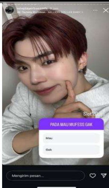
Gambar 2. Penggunaan Fitur Polling pada Story Akun @roleplayerbasemfs