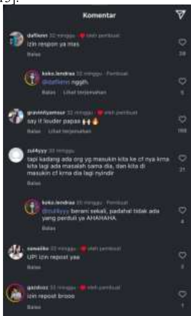
Gambar 1. Kolom Komentar Pada Salah Satu Unggahan Akun @koko.lendraa

Pola interaksi roleplayer di Instagram didominasi oleh Story, Direct Message (DM), dan kolom komentar. Informan @koko.lendraa menyebut interaksi paling sering terjadi melalui balasan Story dan DM, serta mention di kolom komentar. Story menjadi ruang ekspresi identitas yang spontan melalui simbol digital seperti emoji dan gaya bahasa, sedangkan DM berfungsi sebagai ruang privat untuk interaksi mendalam, baik IC maupun OOC, termasuk negosiasi alur cerita. Kolom komentar bersifat publik dan performatif, memperkuat storyline serta membentuk norma dan ekspektasi kolektif (generalized other). Dengan demikian, interaksi RP tidak hanya bersifat teknis, tetapi merepresentasikan proses pembentukan makna dan identitas sosial[13].