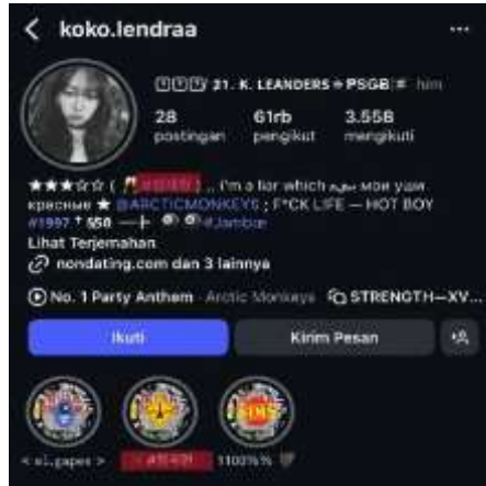
Gambar 4. Contoh Penggunaan Bahasa Korea