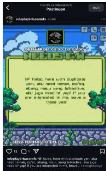
Gambar 5. Contoh Penggunaan Bahasa Slang Fandom

Tangkapan layar tersebut menunjukkan bahwa penggunaan bahasa dan istilah khas fandom berperan penting dalam membentuk pola komunikasi di dunia roleplayer (RP). Bahasa tersebut tidak hanya berfungsi sebagai alat komunikasi, tetapi juga sebagai simbol identitas kelompok dan penanda kedekatan sosial antar pemain.