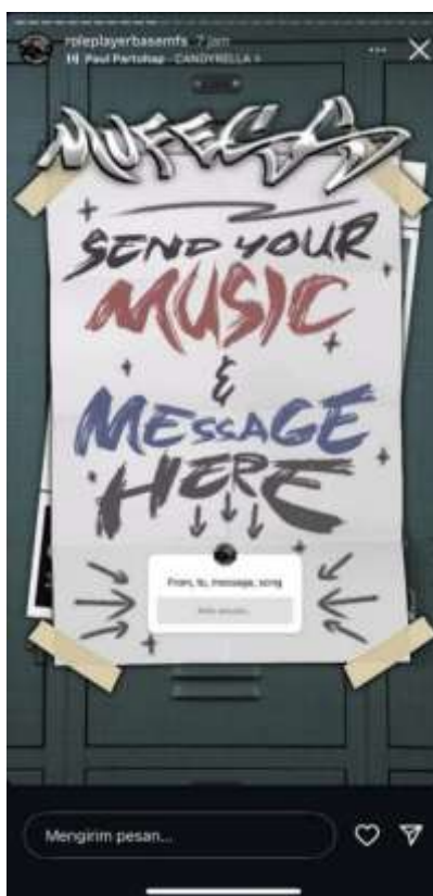
Gambar 3. Penggunaan Fitur Question Box pada Story Akun @roleplayerbasemfs

Di balik kebebasan berekspresi, komunitas roleplayer (RP) memiliki norma sosial tidak tertulis yang berfungsi menjaga kenyamanan interaksi dan keberlangsungan dunia peran. Hal ini terlihat dari pernyataan @koko.lendraa, “nggak boleh bawa-bawa real life, harus sopan ke mutual baru, dan jangan OOC sembarangan,” yang menunjukkan bahwa norma tersebut diinternalisasi melalui praktik sehari-hari. Dalam perspektif Interaksi Simbolik Mead, norma ini terbentuk dari shared meaning yang mengarahkan perilaku anggota komunitas.