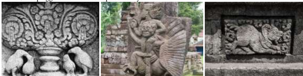
Gambar 5. Dari kiri-kanan bisa ditemui wujud sepasang burung pada relief dari situs Candi Penataran (penggambaran perwujudan Kinara-Kinari); cerita Garudeya dari situs Candi Suku; relief karakter ikonik Kilin dari situs Candi Sanggrahan.

Perlu diketahui juga bahwa setiap relief yang menggambarkan wujud hewan di situs-situs peninggalan era Hindu-Buddha selalu menggambarkan kisah Tantri Kamandaka/Candapinggala. Penggambaran hewan atau tokoh setengah-hewan bisa jadi menggunakan referensi kisah lainnya di luar seri cerita Tantri Kamandaka/Candapinggala. Namun biasanya relief tersebut tetap memuat sebuah makna atau bahkan juga pesan moral seperti halnya relief Tantri Kamandaka/Candapinggala. Berikut beberapa contohnya.