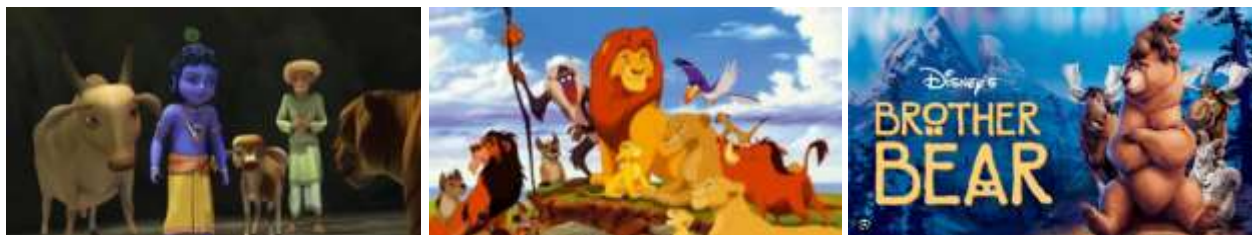
Gambar 6. Dari kiri-kanan, bisa ditemui wujud sepasang burung pada relief dari situs Candi Penataran (penggambaran perwujudan Kinara-Kinari); cerita Garudeya dari situs Candi Sukuh; relief karakter ikonik Kilin dari situs Candi Sangrahan. Sumber

Hasil kajian literatur dan perbandingan naratif menunjukkan bahwa Tantri Kamandaka memiliki daya lenting budaya yang tinggi. Meskipun mengalami perubahan medium dan konteks, nilai-nilai yang terkandung di dalamnya tetap bertahan melalui cerita rakyat dan fabel binatang yang hidup dalam ingatan kolektif masyarakat. Cerita seperti Sang Kancil, Kelinci dan Kura-Kura, serta berbagai fabel lain dapat dipahami sebagai bentuk adaptasi dan transformasi Tantri Kamandaka dalam konteks budaya yang berbeda. Keberlanjutan ini menjadi signifikan ketika dikaitkan dengan perubahan besar dalam sejarah Nusantara, khususnya pada masa masuknya Islam yang membawa pembatasan terhadap penggambaran makhluk hidup. Dalam kondisi tersebut, Tantri Kamandaka tidak lagi diekspresikan melalui seni visual figuratif, tetapi beralih ke medium narasi lisan dan cerita rakyat. Pergeseran medium ini tidak menghilangkan nilai pendidikan karakter, melainkan justru memperluas jangkauan dan daya hidup Tantri dalam masyarakat.