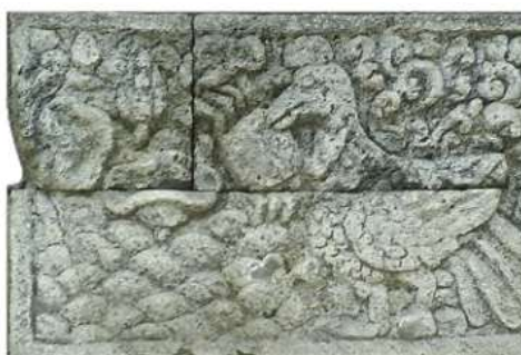
Gambar 3. Relief burung, ular, dan kepiting/ketam di situs Candi Penataran, Blitar, menceritakan tentang sikap balas budi (Candapinggala bagian 15).

Hasil kajian terhadap teks dan narasi Tantri Kamandaka menunjukkan bahwa teks ini beserta turunannya bukan sekadar kumpulan cerita binatang, melainkan sebuah sistem narasi simbolik yang dirancang untuk menyampaikan nilai-nilai etis dan kebijaksanaan hidup secara tidak langsung. Tokoh-tokoh binatang dalam Tantri tidak berfungsi sebagai personifikasi moral hitam-putih, melainkan sebagai representasi kompleks perilaku manusia yang berhadapan dengan dilema sosial, relasi kekuasaan, kecerdikan, keserakahan, empati, dan konsekuensi dari pilihan tindakan.