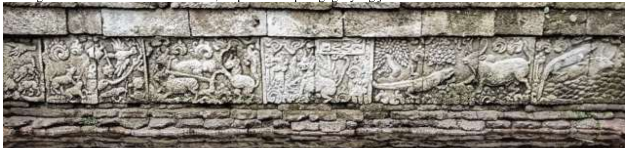
Gambar 4. Rangkaian relief menggambarkan potongan-potongan cerita Tantri Kamandaka di situs Candi Penataran, Blitar. Dari kiri-kanan bisa ditemui cerita Angsa, Kura-Kura, dan Serigala (Candapinggala bagian 7 yang menjelaskan pentingnya mendengarkan nasihat); cerita Kerbau dan Buaya yang mengacu pada kisah Si Kancil yang menceritakan perbuatan baik kerbau yang dibalas kejahatan oleh buaya.

Relief Tantri ditempatkan pada lokasi yang dapat diakses oleh khalayak luas, baik sebagai peziarah, pemuja, maupun pengunjung. Dengan demikian, narasi moral Tantri menjadi bagian dari pengalaman visual masyarakat, yang secara berulang dapat dilihat, dibaca, dan dimaknai. Seni rupa dalam konteks ini berfungsi sebagai media pedagogis yang bekerja secara simultan dengan fungsi religius dan sosial bangunan tersebut. Pendidikan karakter tidak berlangsung di ruang kelas terpisah, melainkan menyatu dengan ruang sakral dan ruang publik. Temuan ini sejalan dengan laporan arkeologis yang menyebutkan bahwa relief naratif pada candi-candi Jawa Timur memiliki fungsi edukatif dan simbolik, bukan sekadar dekoratif [16]. Temuan ini memperlihatkan bahwa pada masa klasik, pendidikan karakter berbasis seni bersifat integratif. Seni, agama, dan pendidikan tidak berdiri sebagai ranah yang terpisah, melainkan saling menopang. Hal ini berbeda secara signifikan dengan kondisi kontemporer, di mana seni dalam ruang publik cenderung berfungsi dekoratif atau simbolik semata, tanpa muatan pedagogis yang jelas.