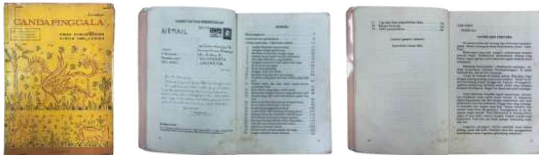
Gambar 2. Tampilan buku Candapinggala oleh Kamajaya, 1982.

Seperti disebutkan pada bagian pendahuluan, bahwa pada penelitian ini secara spesifik disebutkan bahwa teks utama yang digunakan sebagai bahan kajian adalah Candapinggala, terjemahan Tantri Kamandaka dalam Bahasa Indonesia (dari teks asli bahasa Jawa kuno). Keputusan ini dilakukan dengan tujuan demi mendapatkan efisiensi dalam mengkaji dan memperoleh intisari dari teks kitab Tantri Kamandaka. Candapinggala adalah terjemahan yang ditulis pertamakali oleh Kartono Kamajaya. Sebelumnya, Tantri Kamandaka juga pernah diterjemahkan ke dalam bahasa Belanda oleh sastrawan Belanda bernama Dr. Christiaan Hooykaas pada tahun 1931. Candapinggala menjadi salah satu ‘jendela’ terdekat bagi peneliti untuk mempelajari Tantri Kamandaka dengan otentik. Karya jarih payah Hooykaas yang kemudian dilanjutkan oleh Kamajaya ini berhasil menarik dunia akademik terhadap teks ini[1]. etiap bab atau rangkaian cerita menghadirkan konflik moral yang melibatkan tokoh-tokoh binatang, yang secara simbolik merepresentasikan sifat dan perilaku manusia, seperti kecerdikan, kesetiaan, keserakahan, tipu daya, hingga konsekuensi etis dari tindakan yang diambil. Pola naratif semacam ini telah diidentifikasi dalam kajian perbandingan Tantri Kamandaka dan Pañcatantra sebagai ciri khas sastra nīti atau sastra kebijaksanaan hidup [4].