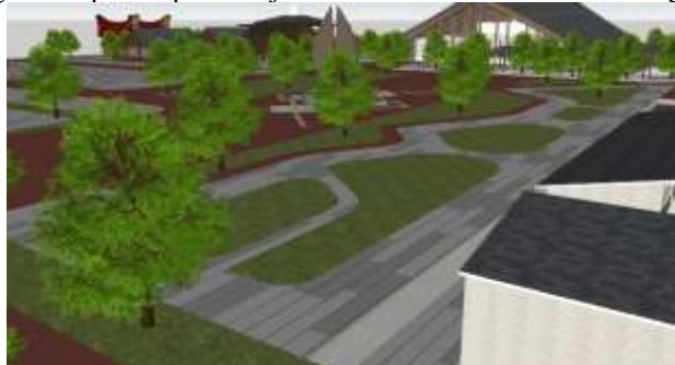
Gambar 4. Pengembangan Jalur Pedestrian

Penguatan jalur pedestrian sebagai jalur interpretatif menunjukkan bahwa struktur sirkulasi yang jelas mampu membentuk pengalaman ruang yang lebih sistematis bagi pengunjung. Jalur yang terorganisir memungkinkan pengunjung menjelajahi kawasan secara bertahap sehingga proses pembelajaran budaya dapat berlangsung melalui pengalaman langsung. Kondisi ini sejalan dengan konsep experiential learning yang menyatakan bahwa pengalaman langsung dalam suatu lingkungan dapat meningkatkan proses pembelajaran secara lebih efektif dibandingkan pembelajaran pasif [7].