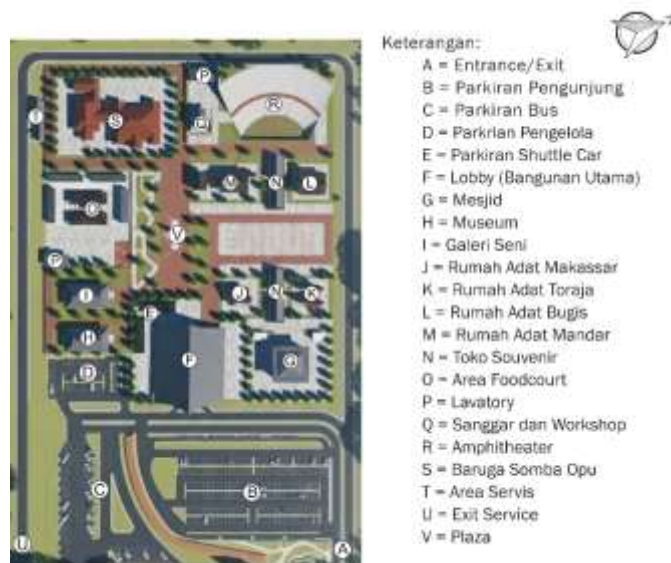
Gambar 2. Masterplan Pengembangan Sub-Kawasan Rumah Adat

Berdasarkan permasalahan yang teridentifikasi, dilakukan pengembangan kawasan melalui pendekatan penataan ulang struktur spasial dengan fokus pada penguatan zonasi budaya, restrukturisasi sistem parkir, pengembangan jalur pedestrian interpretatif, serta integrasi area kuliner berbasis budaya lokal. Konsep pengembangan sub-kawasan rumah adat ditunjukkan pada Gambar 2.