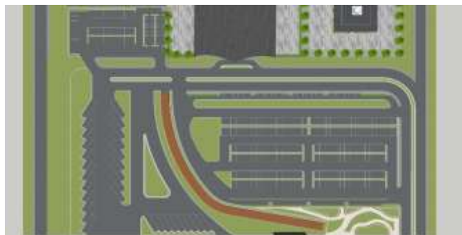
Gambar 3. Penataan Sistem Parkir Kawasan