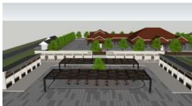
Gambar 6. Zona Foodcourt

Area kuliner dikembangkan menjadi foodcourt tematik yang merepresentasikan budaya Toraja, Bugis, dan Makassar. Integrasi fungsi budaya dan ekonomi lokal memperkuat karakter kawasan serta menciptakan kesinambungan narasi antara arsitektur tradisional dan aktivitas sosial. Dalam teori sense of place, identitas tempat terbentuk melalui keterpaduan antara elemen spasial dan aktivitas sosial yang berlangsung di dalamnya [15]. Pengembangan ini memperkuat karakter kawasan sebagai ruang budaya terpadu sekaligus mendukung keberlanjutan ekonomi lokal. Integrasi aktivitas kuliner dengan identitas budaya kawasan juga memperkuat karakter ruang publik serta meningkatkan daya tarik kawasan sebagai destinasi wisata budaya. Keterpaduan antara elemen fisik ruang dan aktivitas sosial ini merupakan salah satu faktor penting dalam pembentukan sense of place sebagaimana dijelaskan oleh Relph[9]. Visualisasi area foodcourt tematik ditunjukkan pada Gambar 6.