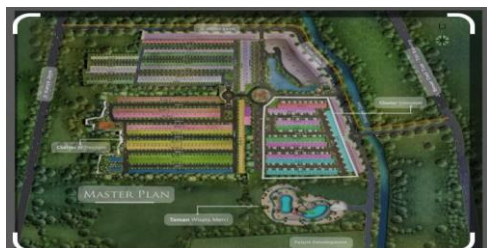
Gambar 2. Penggunaan Lahan Medan Resort City

Permasalahan lingkungan yang sering dijumpai adalah kekeringan pada musim kemarau,