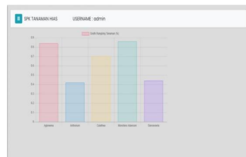
Gambar 3. Halaman Perangkingan

Halaman Perangkingan : Pada halaman perangkingan ini, maka sistem akan menampilkan hasil perangkingan dari setiap alternatif tanaman keladi.