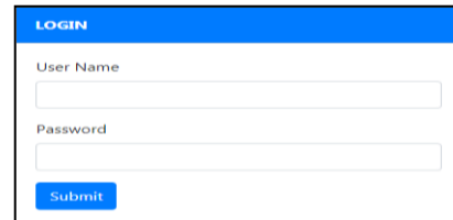
Gambar 1. Halaman Login

pengujian, apakah sistem dapat berjalan sesuai dengan kebutuhan. Untuk masuk ke dalam sistem, maka harus melakukan login terlebih dahulu dengan memasukkan data user name dan password pada halaman login seperti terlihat pada gambar berikut :